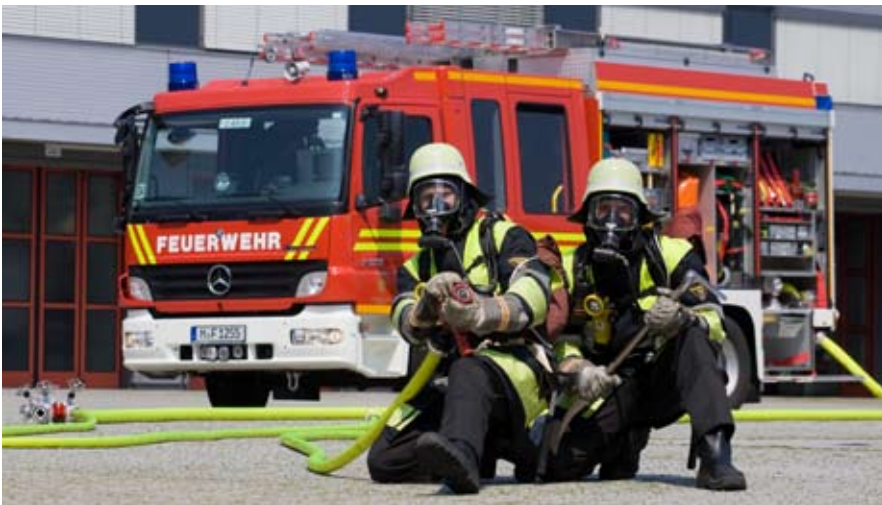
Hilfeleistungslöschfahrzeug auf der Feuerweherschule mit einsatzbereitem Atemschutztrupp